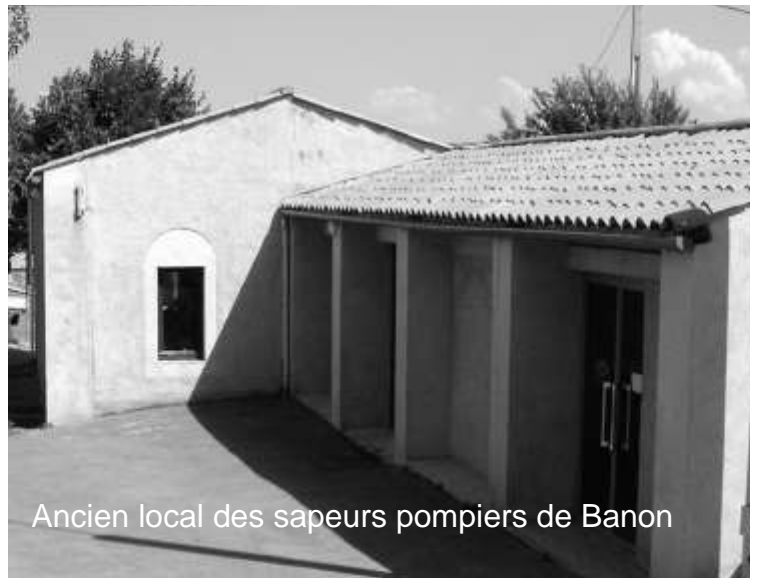
Ancien local des sapeurs pompiers de Banon

Le montant prévisionnel des travaux s'élève à 25 300 € HT, 2 subventions ont déjà été obtenues, 2 530 € de la DGE et 2 530 € au titre de l'enveloppe parlementaire. De plus la DGE fait apparaître une augmentation de ressources de 14 905 € qui seront affectés à ce projet. La CCPB devra prévoir un financement